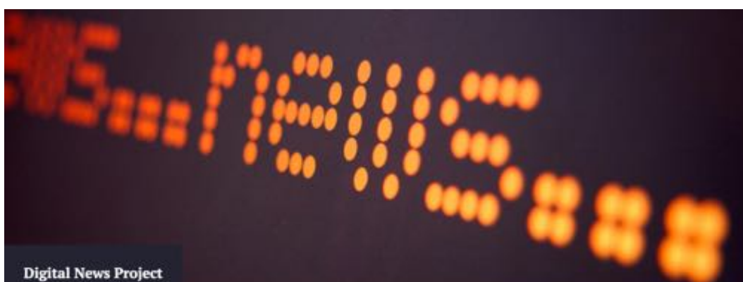
Captura Digital News Report.