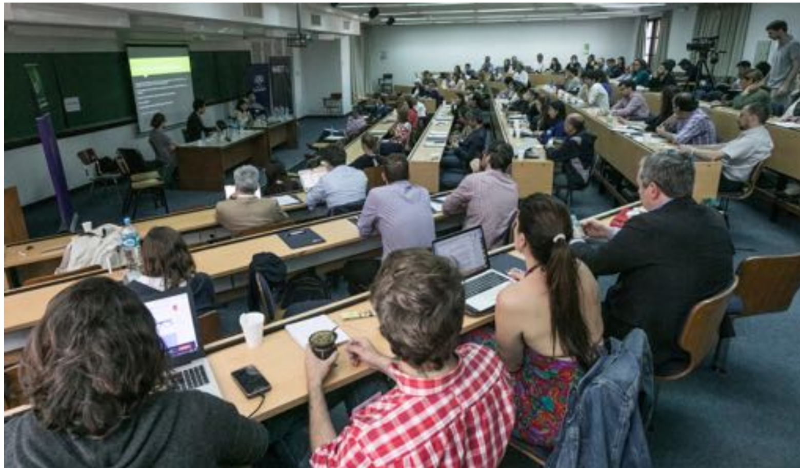
Auditorio durante el Congreso MESO, 2018.

Desde su creación en 2015, se han llevado adelante seis ediciones del congreso anual de MESO: "Desarrollos contemporáneos sobre medios, cultura y sociedad en Argentina y América Latina". En su totalidad, se han presentado 110 papers y 7 conferencias magistrales de investigadores/as asociados a instituciones de 15 países—Alemania, Argentina, Bolivia, Brasil, Canadá, Chile, Colombia, Costa Rica, Ecuador, Estados Unidos, España, Francia, Holanda, México y Suecia—y se han inscripto 1.424 personas. El congreso de 2020, realizado de modo virtual, tuvo asistencia récord con 498 inscriptos/as (+181% respecto del año anterior), y además de las 34 presentaciones hechas de modo regular tuvo dos oradores principales: Homero Gil de Zúñiga (Pennsylvania State University, Estados Unidos, y Universidad de Salamanca, España) y Sallie Hughes (University of Miami).